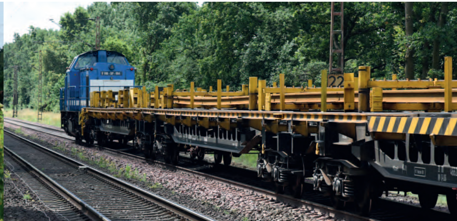
Vollautomatisch: Die Langschienen werden sicher gegriffen und direkt auf die Schwellenköpfe oder in der Gleismitte abgelegt